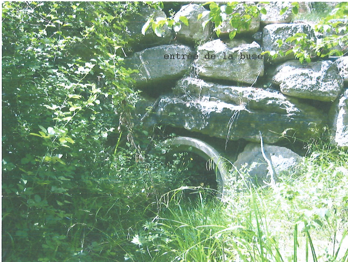
entrée de la buse