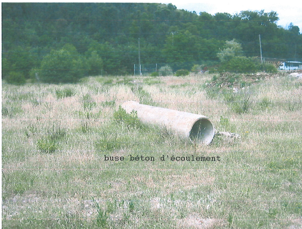
buse béton d'écoulement